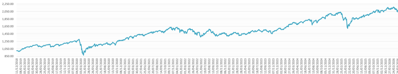
Evolution valeur d'unité

Valeur d'unité à la date du rapport 2037.61 EUR Valeur d'unité au lancement (12/12/2018) 1000.00 EUR